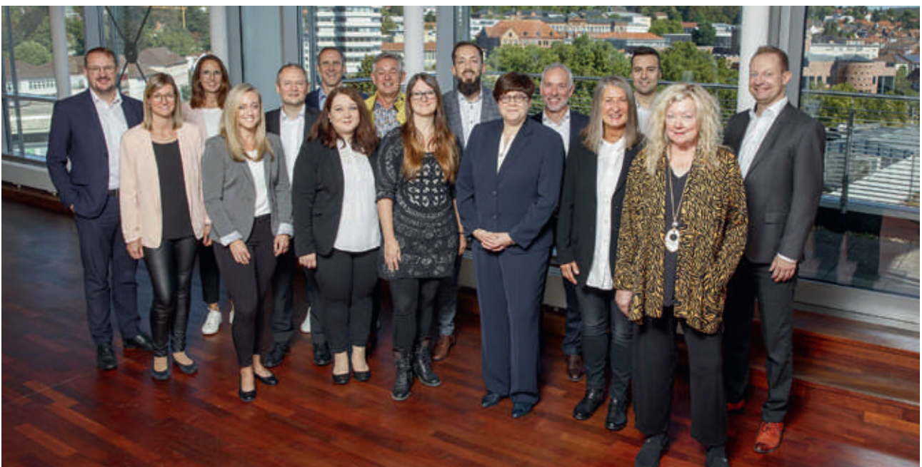
Unsere Finanzierungsexperten für Baufinanzierungen